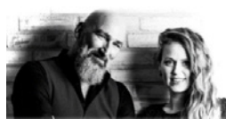
Himmel & Jord Kendte salmer i et drømmende musikalsk univers

71 tilhørerne ved koncerten i Ejstrup kirke fredag den 2. februar gik bestemt ikke forgæves. Spændende at høre kendte salmer i en let bearbejdet udgave.